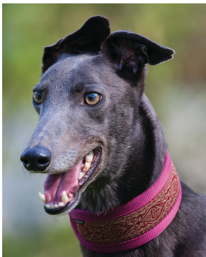
Jayden, ein sehr angenehmer ruhiger Junge, der draußen im Garten auch mal aufdrehen kann.