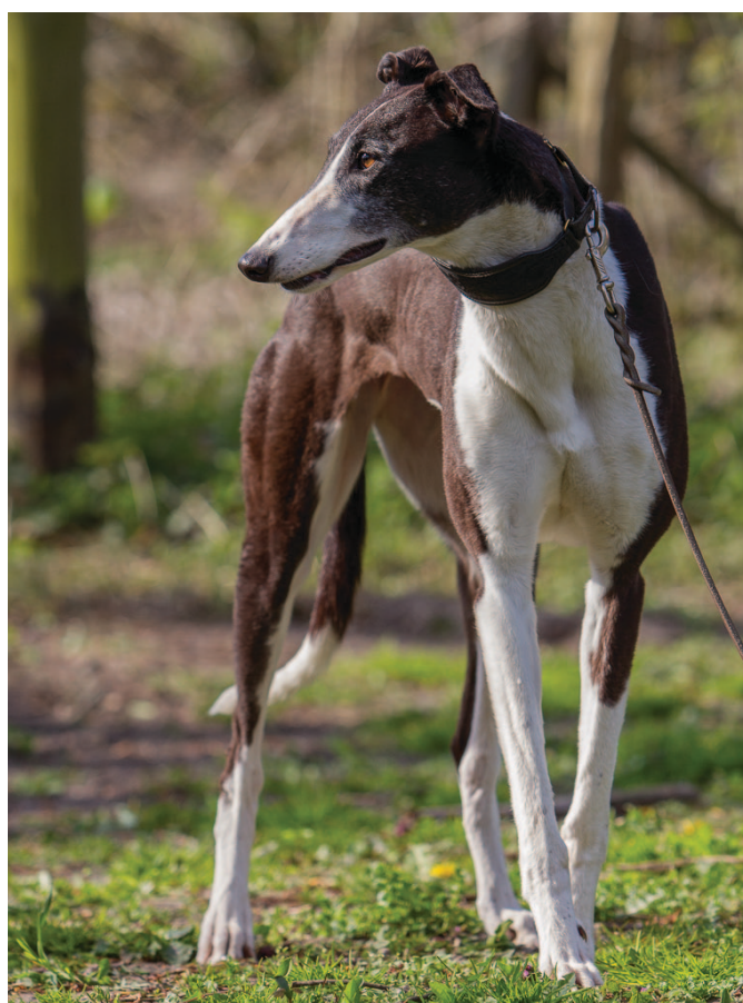
Victoria, die Flummi- Maus, ist für ihr Alter (16 Monate!!!) absolut klasse.