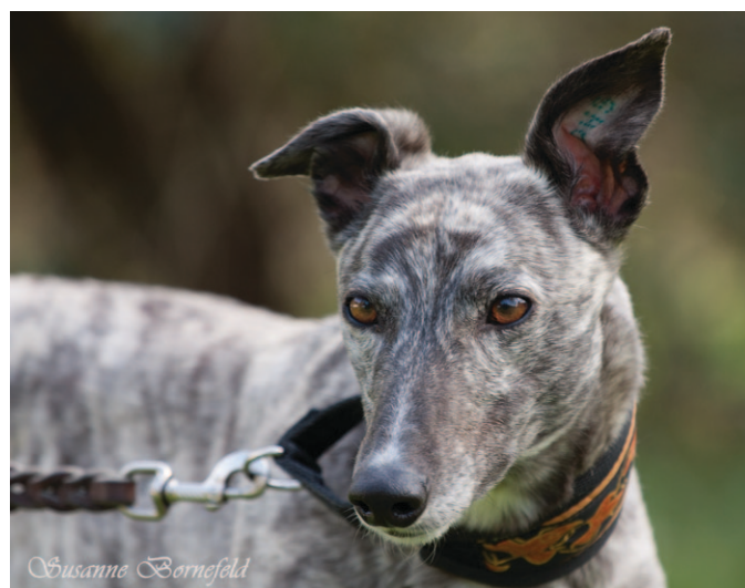
Unsere kleine Tigger hat sich zu einer aktiven, an allem interessierten, liebevollen Hündin entwickelt.